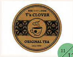
ティーズクローバー 紅茶、スコーン