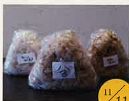
Yummy おにぎり、お味噌汁