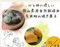
木のぼりCafe クッキー、パウンドケーキ