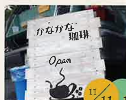
かなかな珈琲 オーガニック珈琲と紅茶