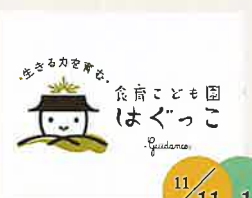
食育保育園 はぐっこ 季節の野菜を使った料理