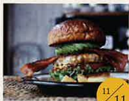
テンズ 自家製コーラ、ハンバーガー