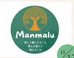
Manmalu 出し玉チーズおにぎり 砂糖不使用ドリンク