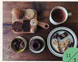
SUN CACAO カカオを使ったお菓子