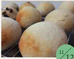
ゆっきーパン 米粉パン