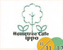
Hometree Cafe ippo 重ね煮のスープ